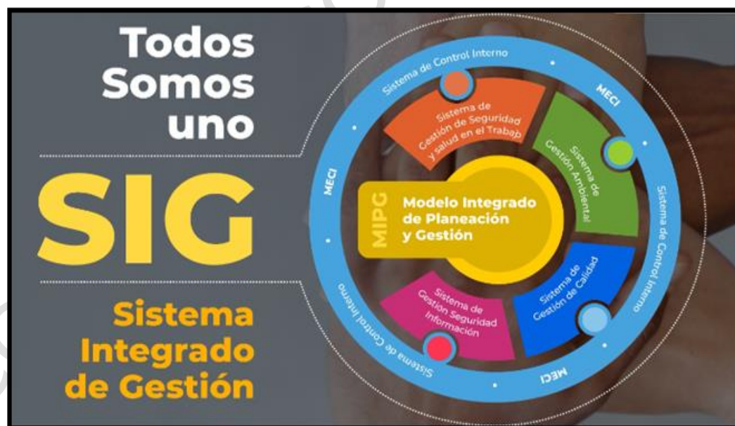
Ilustración 4 Gráfico Sistema Integrado de Gestión

En la entidad se ha definido y desarrollado el esquema de comunicación "Todos Somos Uno SIG-Sistema Integrado de Gestión", el cual representa la integración de los sistemas de gestión, en un único Sistema Integrado de Gestión, que permite a la entidad, tener herramientas para facilitar el cumplimiento de las necesidades de las partes interesadas y grupos de valor.