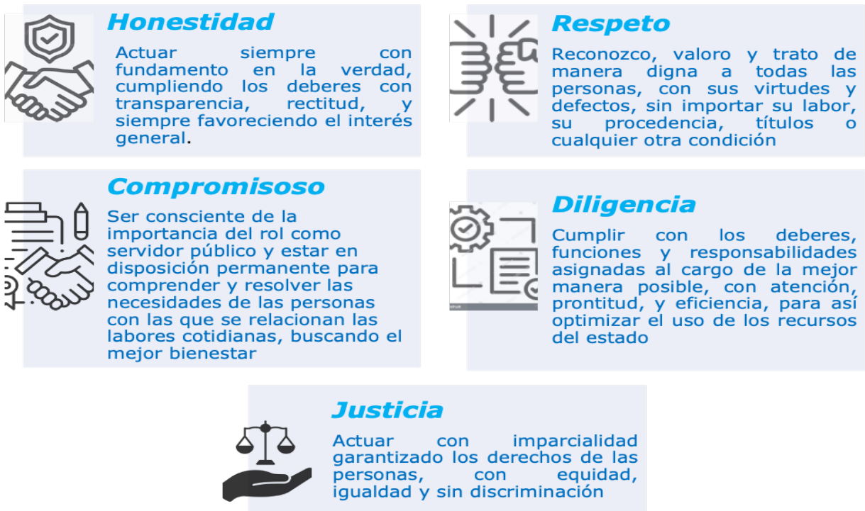
Imagen 1. Valores institucionales.