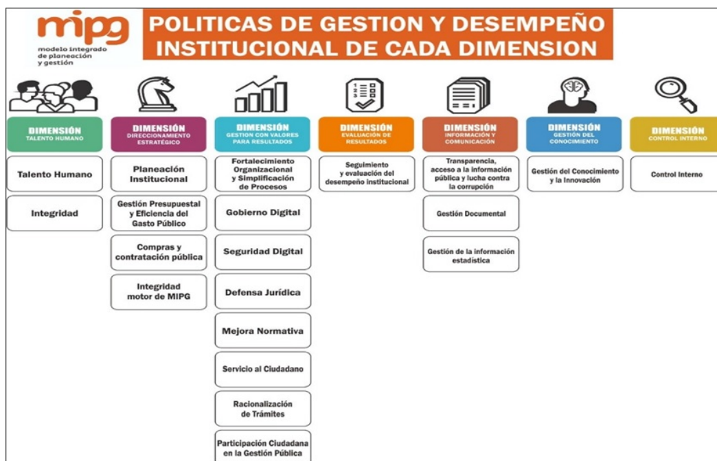
Imagen 5. Políticas Modelo integrado de planeación y gestión

Cada una de las 7 dimensiones se desarrolla a través de una o varias Políticas de Gestión y Desempeño Institucional, a continuación, se relaciona cada una: