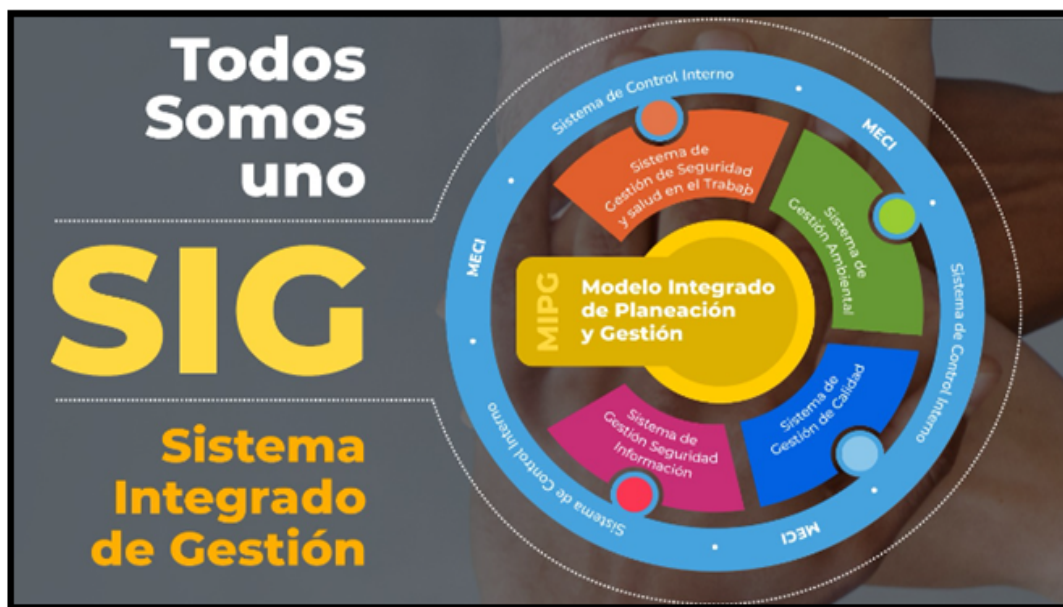
Imagen 3. Esquema Sistema integrado de Gestión

El MVCT ha definido y desarrollado el esquema de comunicación “Todos Somos SIG- Sistema Integrado de Gestión”, el cual representa la integración de los sistemas de gestión, en un único Sistema Integrado de Gestión, que permite a la entidad, tener herramientas para facilitar el cumplimiento de las necesidades de las partes interesadas y grupos de valor.