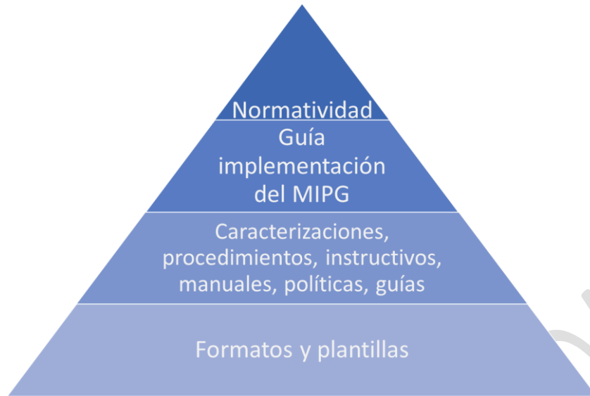
Figura 1: Documentación del SIG