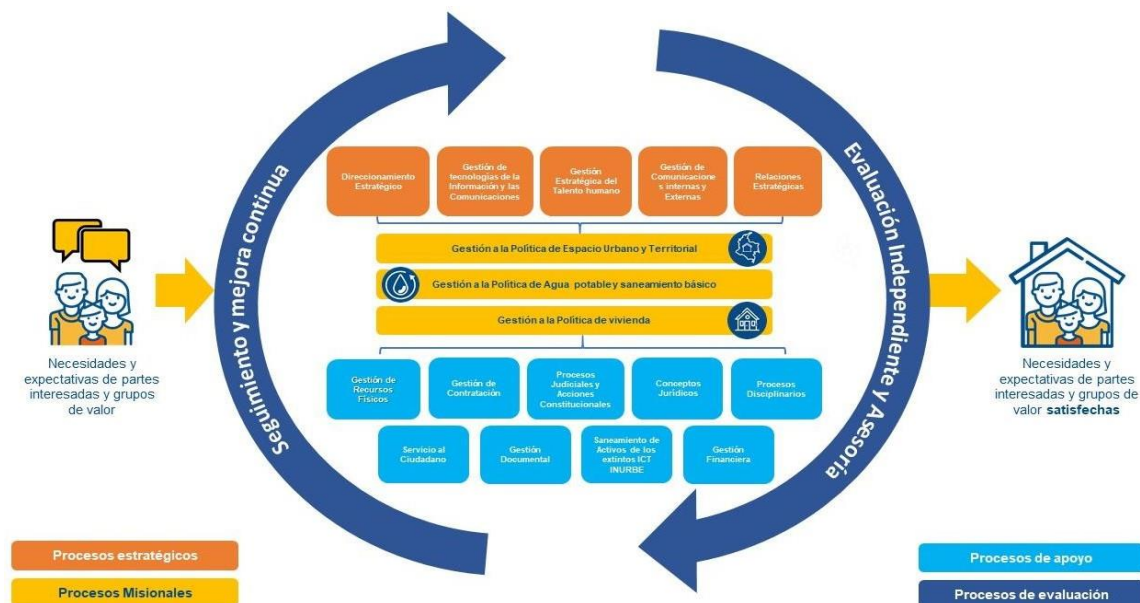
Figura 2: Mapa de procesos MVCT

Teniendo en cuenta los procesos del SIG del MVCT, los cuales se clasifican en cuatro categorías: estratégicos, misionales, de apoyo y de evaluación,